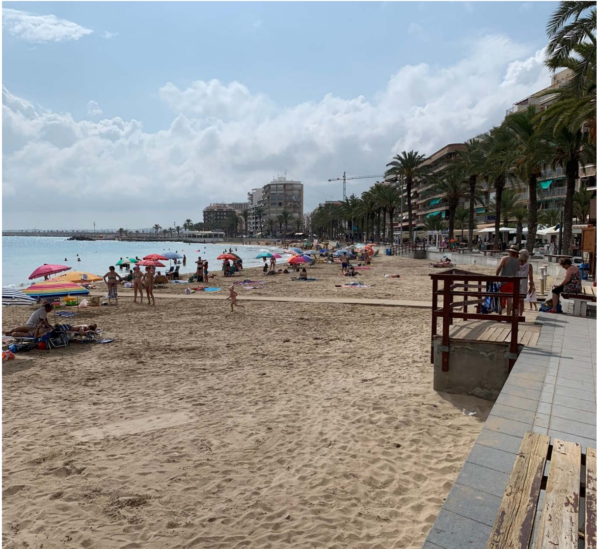
Stranden i Torrevieja sentrum

Torrevieja by ligger ca. 3,5 kilometers gange fra Restaurante Nautilus. Fra leilighetene kan en ta taxi som koster ca. 10 Euro. Vi anbefaler å be taxien kjøre til Puerto Torrevieja, slik at du kan vandre langs strandpromenaden. Her finner du en rekke butikker og serveringssteder.