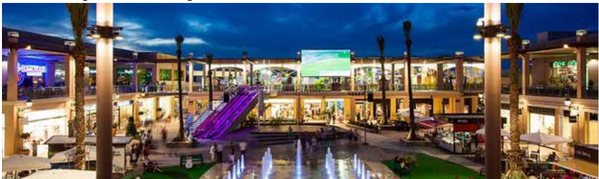
Zenia Boulevard senteret på kveldstid

Er du på jakt etter shopping så er Zenia Boulevard senteret å anbefale. Senteret ligger ca. 3 km fra leilighetene og butikker i alle prisklasser. Her finner du også en rekke restauranter i tillegg til underholdning for både store og små.