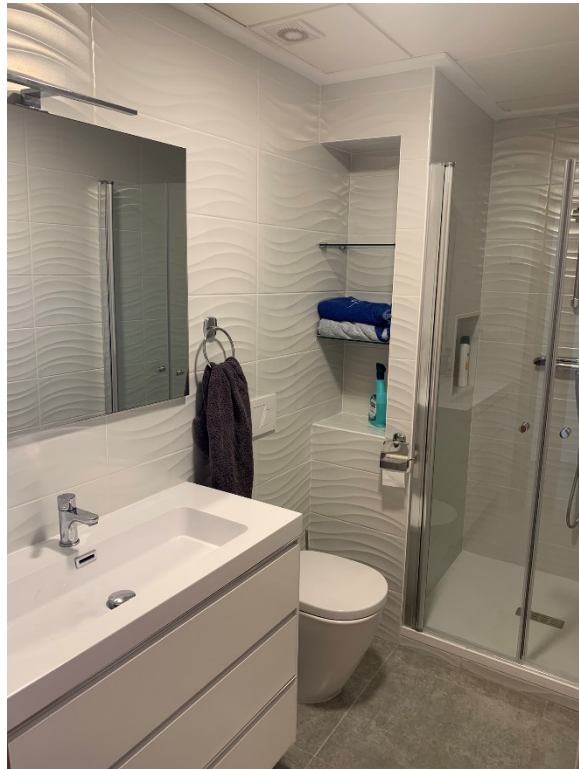
Soverom med dobbeltseng og bad

Det er åpen stue- og kjøkkenløsning med god planløsning for at en kan lage mat, se på TV (vi har norske tv-kanaler) og spise middag. Kjøkkenet er moderne utrustet og innehar også Oppvaskmaskin.