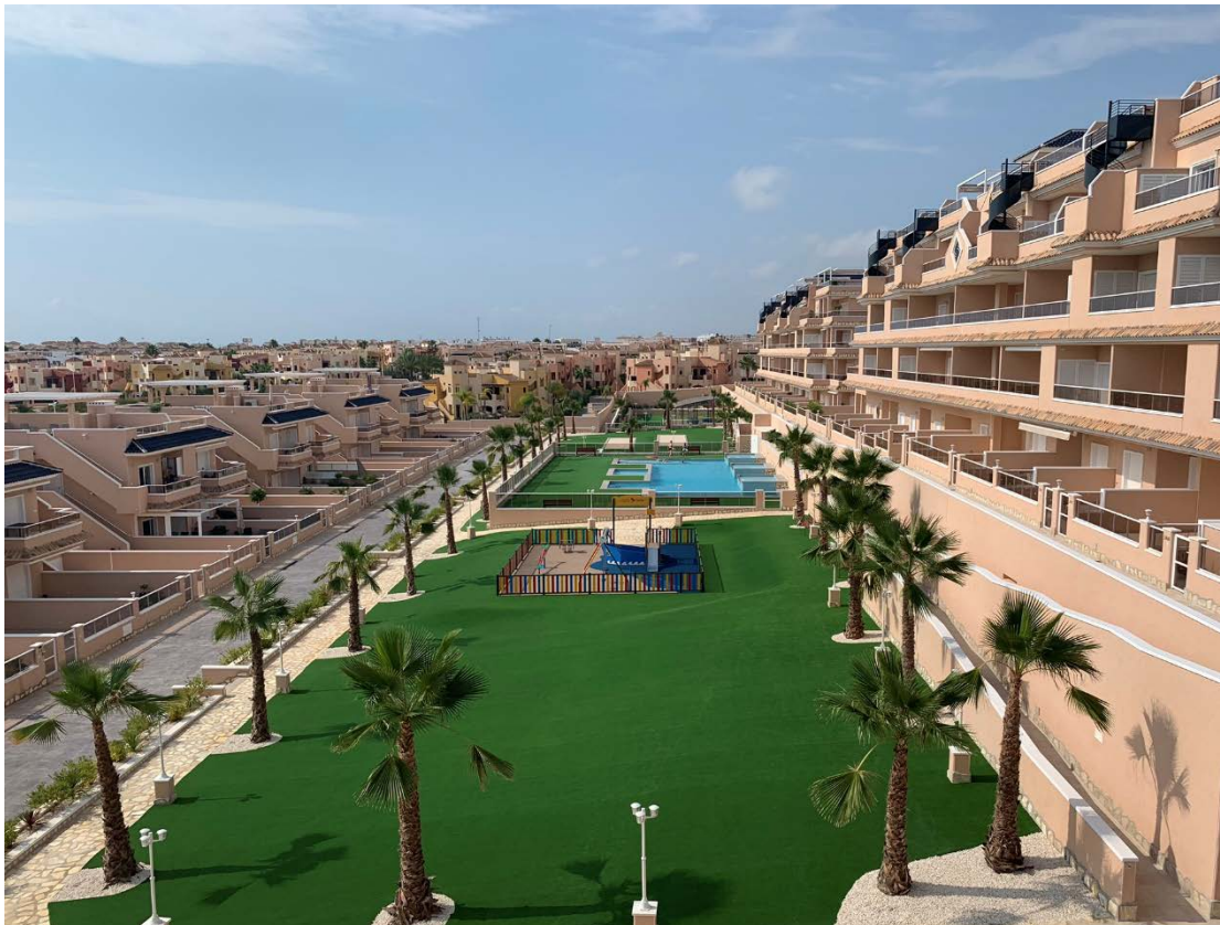
Utsikt fra leilighetene - fellesområde

Våre leiligheter ligger i et flott leilighetskompleks ferdigstilt i 2019 med flotte moderne uteområder.