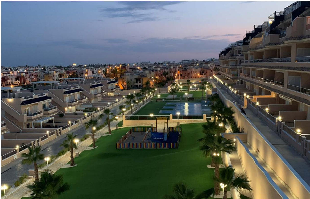
Utsikt fra leilighetene på kveldstid

Leietaker må selv være tilstede og kan ikke leie på andres vegne.