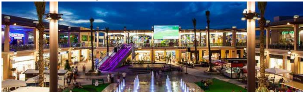
Zenia Boulevard senteret på kveldstid

Er du på jakt etter shopping så er Zenia Boulevard senteret å anbefale. Senteret ligger ca. 3 km fra leilighetene og butikker i alle prisklasser. Her finner du også en rekke restauranter i tillegg til underholdning for både store og små.