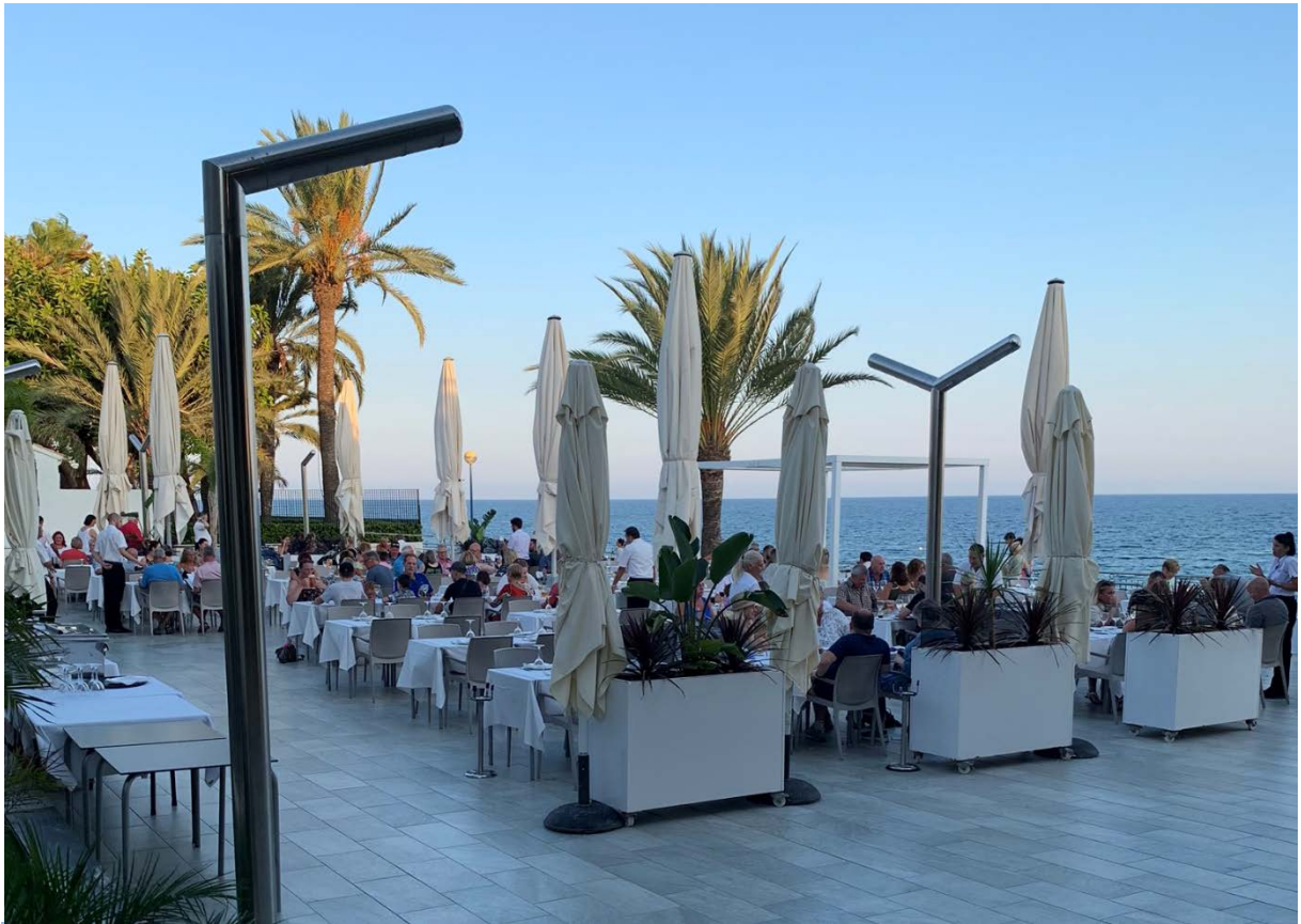
Restaurante Punta Prima og Playa Punta Prima